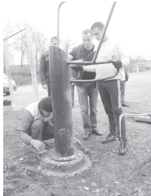
На снимке: Через несколько дней бетон затвердеет, и турник будет готов принять желающих потренироваться.